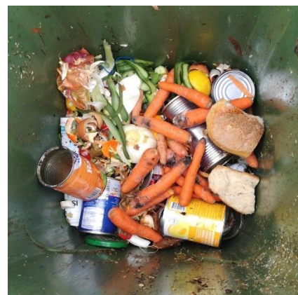
Exemple de déchets retrouvés dans les conteneurs à compost.

Malgré le rappel figurant dans l'Information à la population du mois de décembre, il semblerait que le concept de tri des déchets et notamment des petits déchets verts ménagers ne soit pas clair pour l'ensemble de la population. Nous précisons donc que les boîtes de conserve, même celles ayant contenu des fruits ou légumes, ne sont pas considérées comme des déchets compostables. Elles ne doivent donc pas être déposées dans les conteneurs verts situés à la place de l'abri PCi.